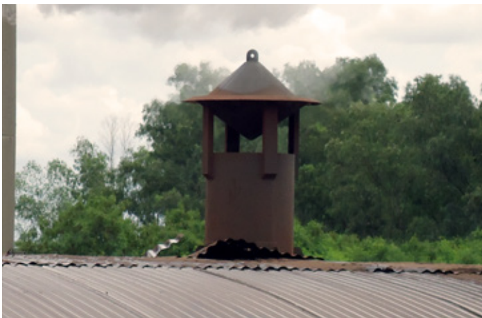
Abafador de Ruído

Em conformidade com a NR – 15 - Anexo 01 Ruído, um abafador de ruído foi instalado na Caldeira 02, para atenuar ou diminuir o nível de poluição sonora do setor, proporcionando melhores condições de trabalho e conforto durante a realização das atividades.