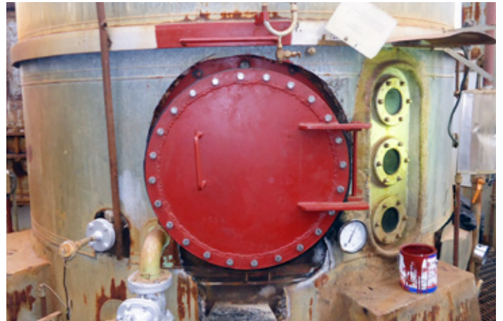
Boca de Visita nas caixas de evaporação