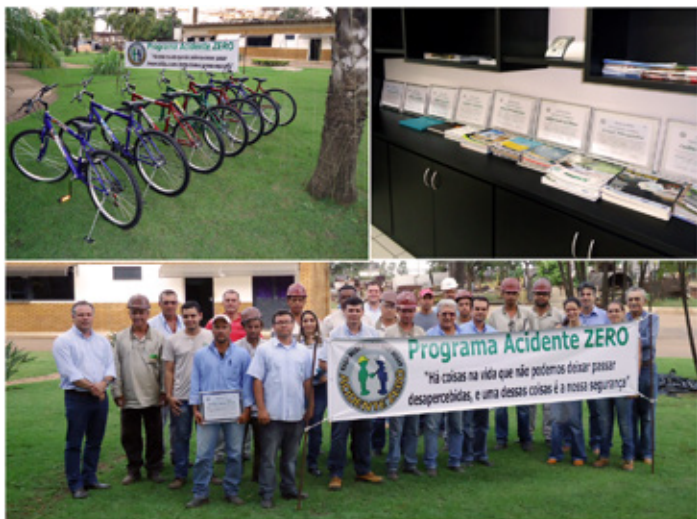
Bicicletas e certificados entregues aos encarregados homenageados

Agradecemos a todos pelo desempenho no ano de 2013 e contamos com o empenho e dedicação para a safra 2014/2015.